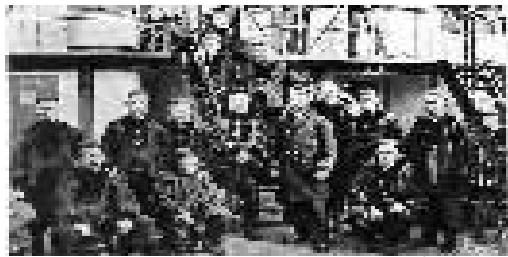
致远舰管带邓世昌和船员及舰上军官