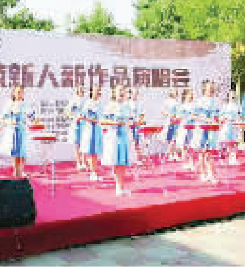
何家庄村举办京东大鼓星火日庆祝活动