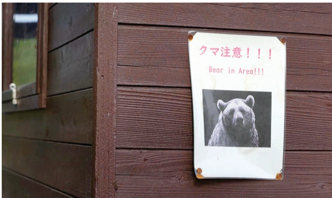
“熊出没”地区贴出告示进行警示。 视频截图