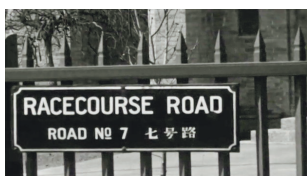
安立甘教堂院墙围栏所钉英租界路牌旧影:“Racecourse Road 马场道/7号路”,美国驻津领事官嘉威乐(J. K. Cardwell)私人电影片截取静帧(美国胡佛研究院馆藏,1936年拍摄)