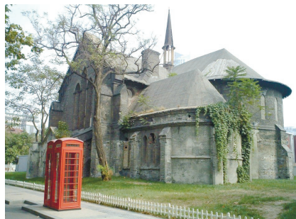
天津安立甘教堂修缮改造前旧影