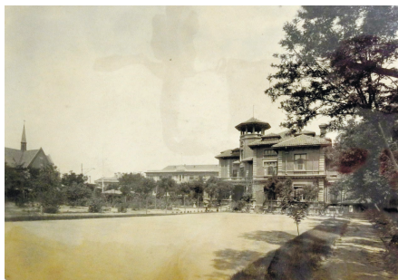
英国领事公馆院内旧照,院外最左侧为安立甘教堂(摄于1930年代)

在水坑这想盖一个教堂,英国侨民专用。因为中国圣公会的教堂,参加活动的人员包括牧师(以及教友),都是中国人,用中国话来听讲。英国人参加,听不懂(语言),所以必须用英语来进行宗教仪式活动,还有唱诗、唱歌。(因为他唱英文歌,不会唱中文歌。无形中(英国人)就想单另来一个(专为英国侨民服务的教堂),就盖的这个安立甘教堂。还有一个因素,就是嘛呢?它不完