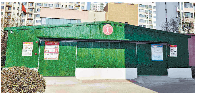
曹庄欣苑车棚建成未启用