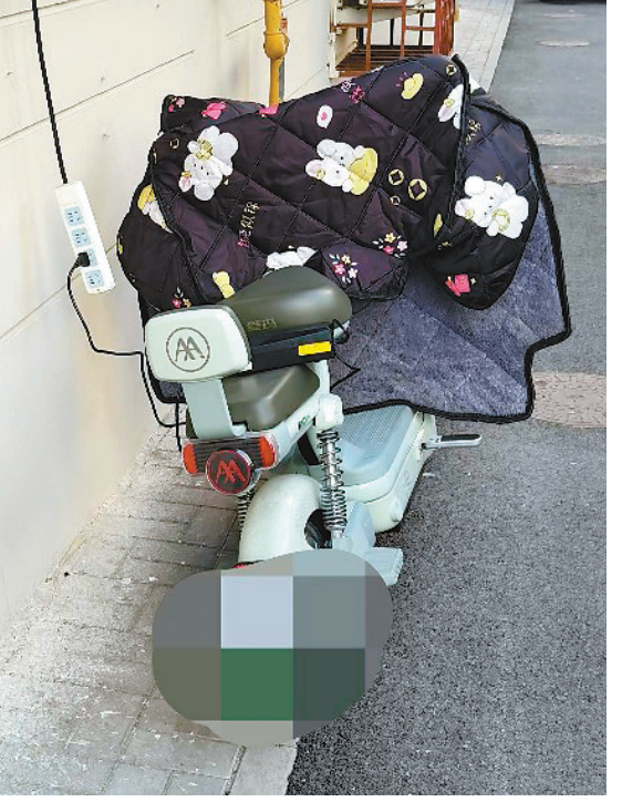
居民无奈“飞线”充电

的育才里、育学里也建有车棚,里面改造了一批电动车充电设施。记者来到育才里的其中一处车棚看到,车棚设有十几个充电口,共有十几辆电动车在这里存放,充电的电动车仅有一辆。“车棚距离小区太远了,而且除了充电费用外,还要额外收取停车管理费,充电成本太高了。”居民们说。记者从地图上,育才里的车棚距离谊城公寓最远的一栋楼有300多米,步行至少需要五六分钟。记者在谊城公寓走了一圈,发现小区内一些楼栋门前有电动车“飞线”充电的情况,还有的居民窗前,“悬”着插线板。在小区的一片高层楼下,记者看到有一处电动车充电车棚,车棚内充电位不少,但是该高层区域有门禁,实行单独管理,外车无法进入,充电车棚仅能供高层区域居民使用。该区域保安表示,这个区域实行物业管理,小区内人口多,充电设施本就供不应求,所以无法对外开放使用。