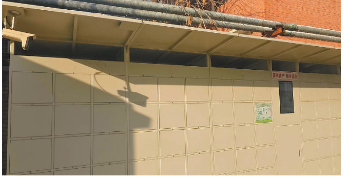
大型电动车电瓶充电柜使用率不高