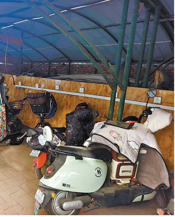
育才里车棚里改建的充电设施使用率不高