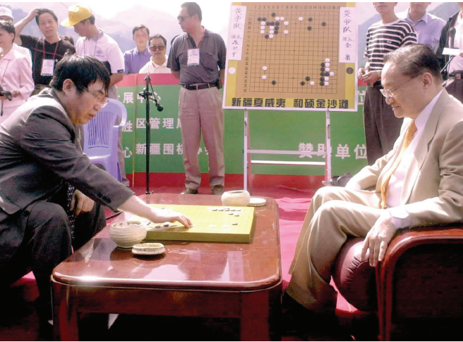
2001年8月5日,聂卫平(左)与金庸在新疆天池畔对弈。