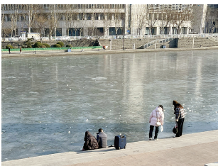
古文化街亲水平台