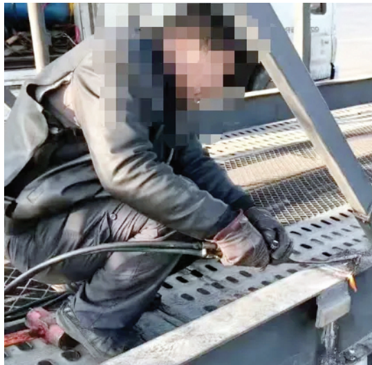
对加长和加宽的部位现场切割作业

岁末年初,高速公路的车辆逐渐增多,一些重型特殊结构半挂车的驾驶人想靠“魔改”货车“多装多赚”。他们把挂车私自加长、加宽,殊不知这“加长版赚钱工具”早成了高速公路上的“移动炸弹”。本市高速交管支队直接精准“亮剑”,盯着这些违法改装、超载超限的商品车运输车,不仅现场查处“越长越贪心”的违法车辆,还同时让私改车辆现场恢复原样。