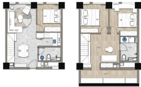
约 156 万元入住 约 65.07 平方米毛坯 LOFT 公寓