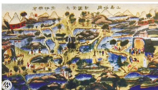
图①(情景再现)飞鸽自行车组装车间 图②天津长芦盐场 图③范旭东与永利碱厂 图④杨柳青年画《出嘉峪关》