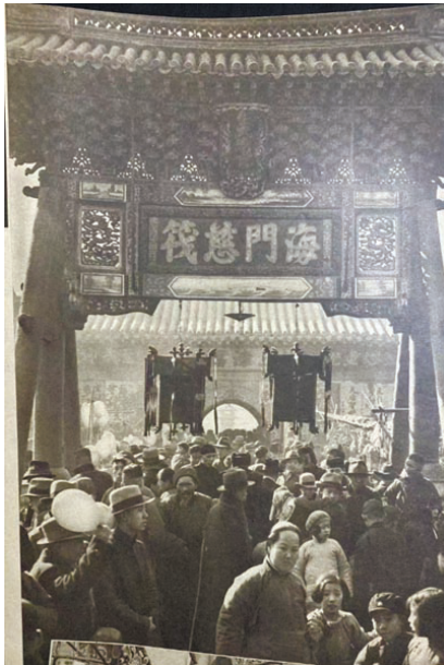
天后宫内景象(拍摄于1938年正月)