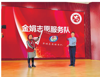
金娟志愿服务队成立