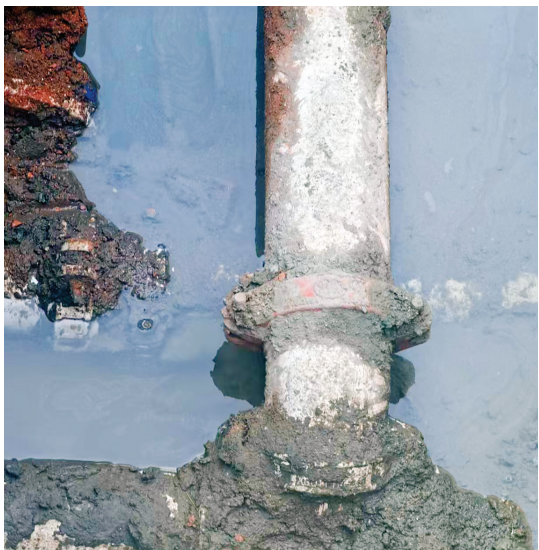
管道连接处的金属卡箍