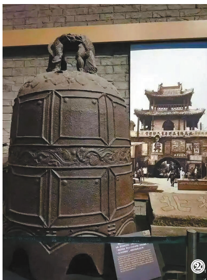
图①:1921年新建的鼓楼。图②:现保存在天津博物馆的原鼓楼大钟。

容为:“高敞快登临,看七十二沽往来帆影;繁华谁唤醒,听一百八杵早晚钟声”。鼓楼东面的门额上写有“声闻于天”四个字。