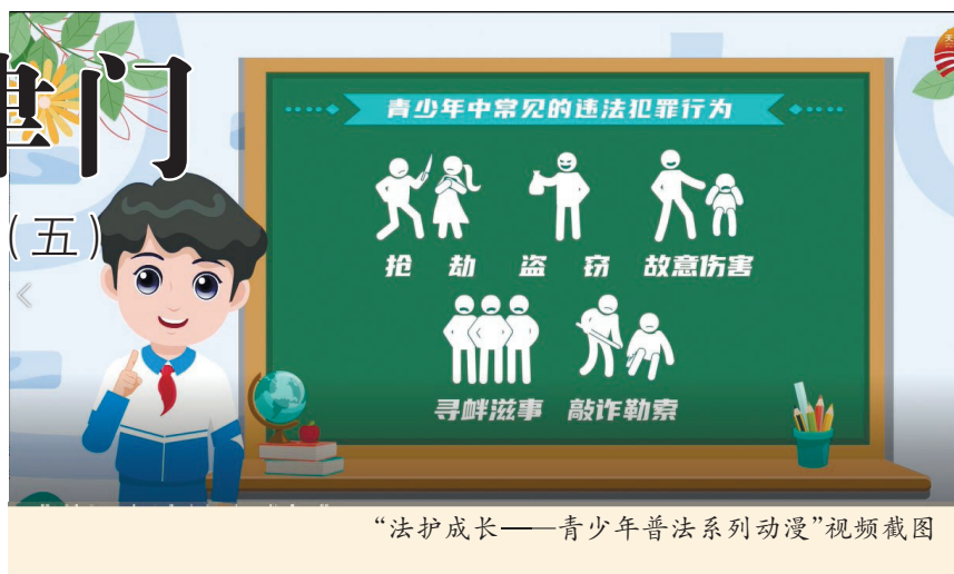
“法治成长——青少年普法系列动漫”视频截图

司法守护如何精准护航?法治教育怎样浸润童心?未成年人权益如何筑牢防线?日前,《文明天津大家谈》“未成年人思想道德建设”系列访谈推出第五期,邀请市人民检察院、市公安局、市司法局相关部门负责人走进天津新闻广播直播间,分享在未成年人犯罪防治、法治宣传教育、权益司法保障等方面的创新实践,全方位解锁未成年人健康成长的“法治密码”。