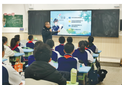
公安北辰分局民警在天津市九十二中学开展网络安全知识宣讲

友”系列反诈短片转发量超20万次,以轻松有趣的方式提升未成年人的防骗意识。未来,还将尝试组织拍摄法治情景剧、围绕法律热点问题组织小型辩论赛等更多学生喜闻乐见的形式。