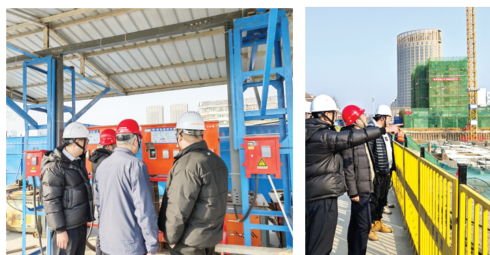
邵公庄南智慧颐养城市更新项目