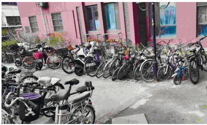
清理前停放的多辆废旧自行车