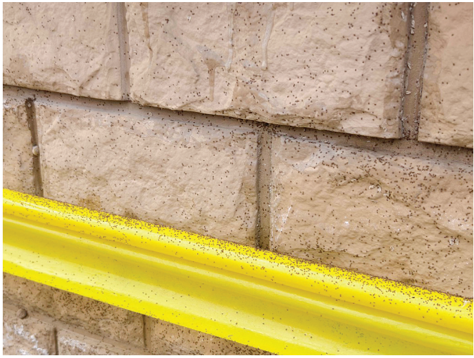
大量小虫爬满墙 看着头皮发麻