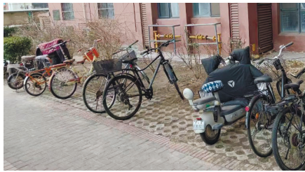
废旧自行车已被清理

本版2月11日刊登《废旧自行车占用公共空间》一文,报道和平区宜天花园小区废旧僵尸自行车堆放问题,引起相关部门的高度重视。社区牵头物业,于春节前对小区内的废旧自行车进行了集中清理并处置。