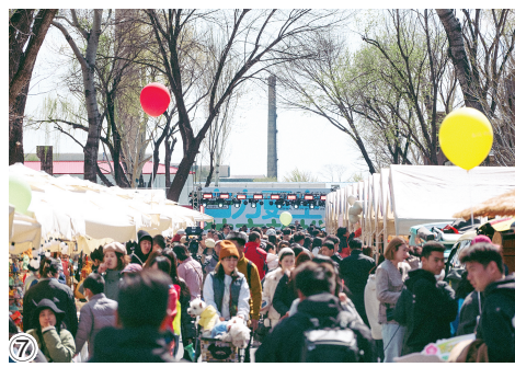
图①天津空天数字产业园吸引了帕西尼等头部科技企业落户 图②泰达格调锦云-景观区 图③泰达格调观麟-样板房 图④泰达格调馥颂-公共空间 图⑤泰达格调玖章-地下停车区 图⑥津一PARK天津机床工业博物馆 图⑦津一PARK活动现场游人如织

城市是现代化的重要载体,承载着人民对美好生活的向往。以此为奋斗目标,泰达城投以城市更新为切入点,努力将城市历史的厚度转化为美好生活的高度,通过整体谋划、系统推进,历经四年多的探索实践,已在城市运营中走出一条统筹产业、生态、配套与居住协同发展的新路径。