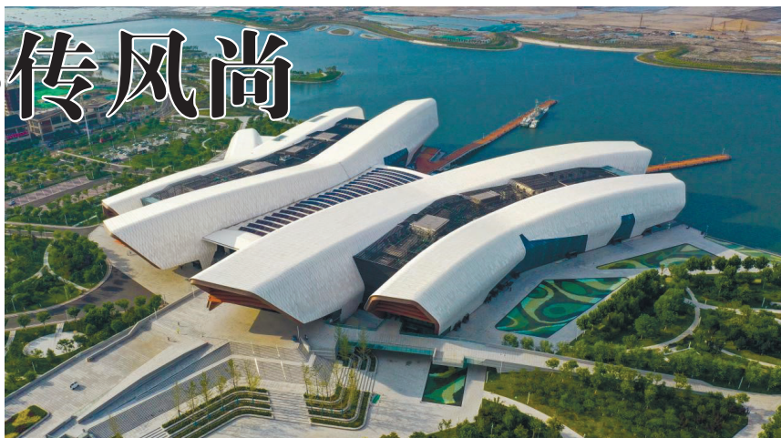
中建八局华北公司承建的国家海洋博物馆已成为天津城市地标

日前,天津新闻广播(FM97.2 AM909)《文明天津大家谈》特别节目,邀请中建八局华北公司一线工作者走进直播间,分享一支建筑铁军如何在服务国家战略、铸造时代地标、践行社会责任的征程中,谱写物质文明与精神文明交相辉映的壮丽篇章。