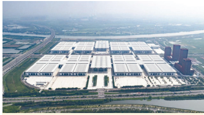
中建八局华北公司承建的国家会展中心(天津)项目

他阐释道,中建八局以“拓展幸福空间”为使命,所理解的精品工程,“不仅是质量获得大奖,更要能承载社会责任、服务国家战略,让大家的生活更美好”。他以获奖项目国家会展中心(天津)和国家海洋博物馆为例,指出荣誉“既是对建造水平的肯定,更是对项目本身服务国家战略、丰富公众文化生活的价值认可”。