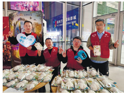
“关爱星星的孩子”主题观影活动

坚持:“关爱星星的孩子”志愿服务,今年已经是我们连续第十年走进这群特殊的孩子的世界。”