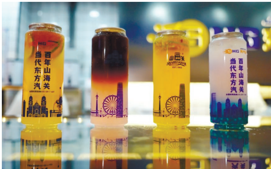
“山海关充气站”果饮(左二为咖啡果饮)

这份历经百年的原始档案,记载了山海关汽水的沧桑过往。天津档案馆的于淼介绍:“档案显示,1902年3月19日,(万国矿水)公司召开了第一次董事会,选举了第一任董事长伯林庚,他是参与京奉铁路建设的英国工程师。汽水公司还和京奉铁路局签署了一份协议:京奉铁路局每年为汽水的运送提供十吨车皮,在运费上提供减免。由此,京奉铁路覆盖的周围地区,也就成为山海关汽水的主要销售范围。”