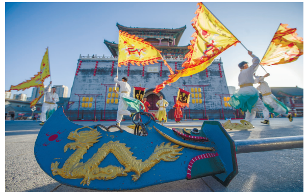
“回族重刀武术”在鼓楼一展风采。