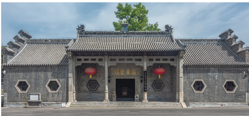
广东会馆的整体建筑风格为岭南建筑,但建筑细节和功能体现了南北融合。

天津广东会馆的建筑形态可以从广州府的传统祠堂或其他公共建筑当中提取到原型母体。对于广东会馆布局特点的研究,沿袭和借鉴《祖先之翼——明清广州府的开垦、聚族而居与宗族祠堂的衍变》中对于广州府祠堂建筑形制的总结。决定广东会馆建筑布局有“路”和“进”两个重要因素。路就是与山墙平行的方向,一座广东会馆内沿一条纵深轴线分布而成的建筑与庭院序列被称为一路。中间的一路通常被称为中路,左右两边为边路。进就是与正脊平行的方向,沿面阔方向平行的一组单体建筑被称为一进,中轴线上有几座单体建筑,整体建筑就有几进。所以路数和进数相组合,就决定了广东会馆建筑的整体规模大小。天津广东会馆原由照壁、会馆、南园、广业公司、同乡宾馆和东院等部分组成,占地面积原为15000多平方米。现存会馆的主要建筑部分,占地面积约为2400平方米。整