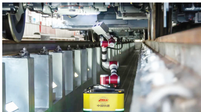
地铁1号线检修机器人

立体“天空之眼”利用无人机与电子围栏编织成立体防护网,24小时守护地铁“领空”,使重大风险