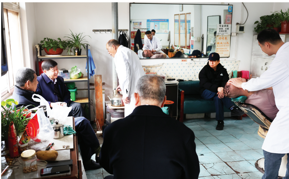
店里还有瓜子,很多老顾客到这只为歇歇脚、聊会儿天儿。