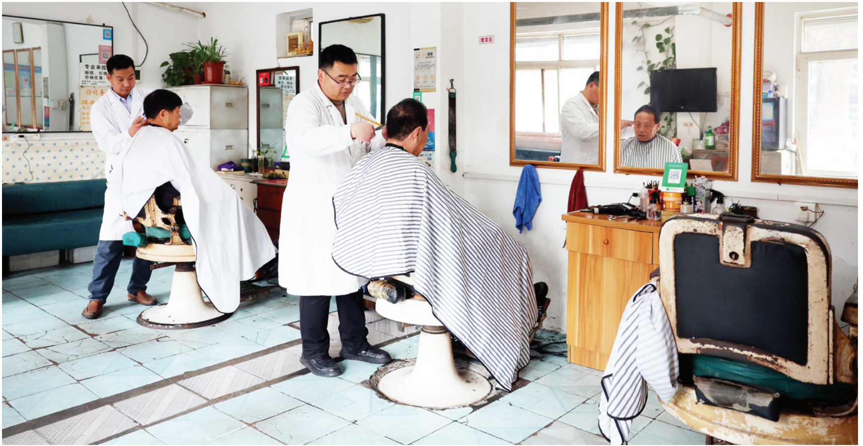
老式的理发椅,锈迹斑斑却很稳当。