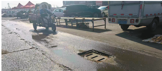
北辰区小淀镇秀水馨苑北侧的小淀路