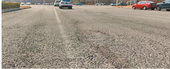
东丽区跃进北路与方山道交口