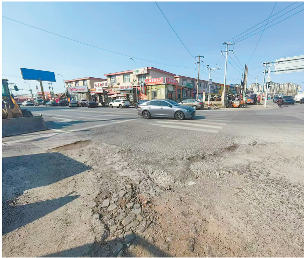
津南区白万公路与鑫港五号路交口