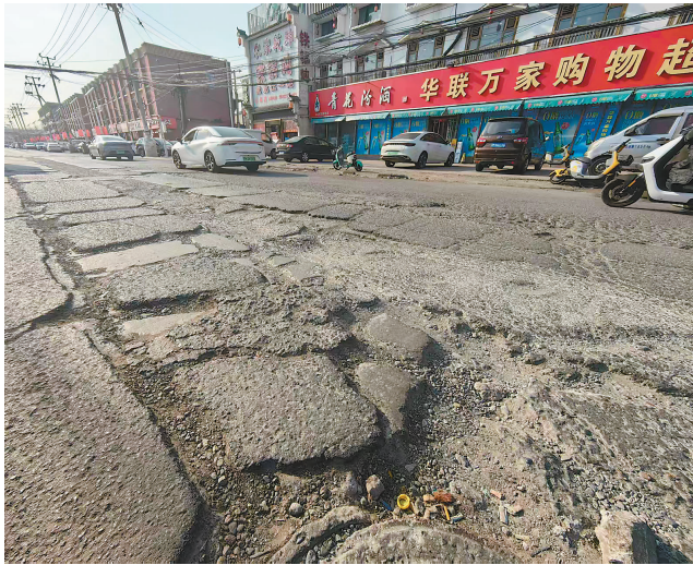
北辰区宜兴埠镇华盛道