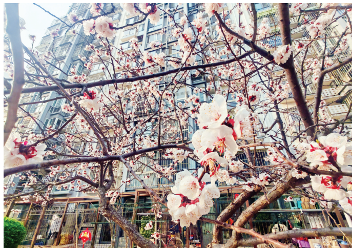
盛达园社区桃花绽放