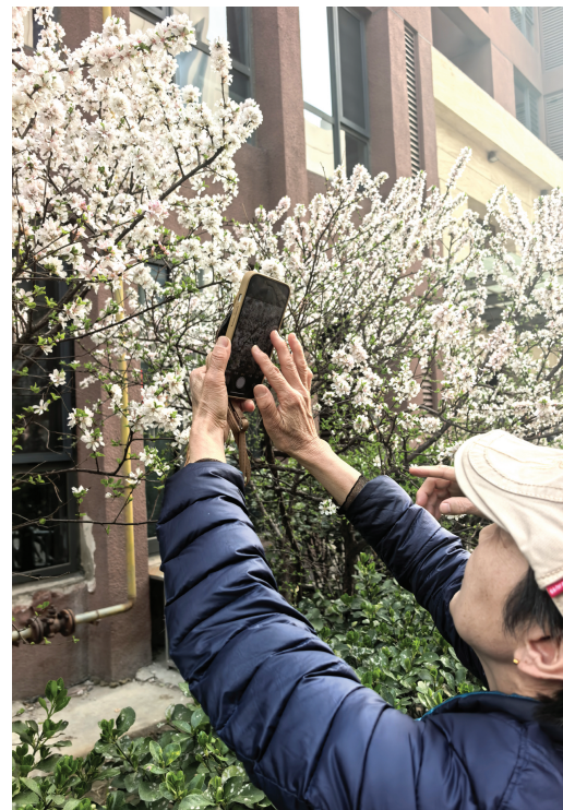
宜天花园小区的桃花吸引居民拍照留念