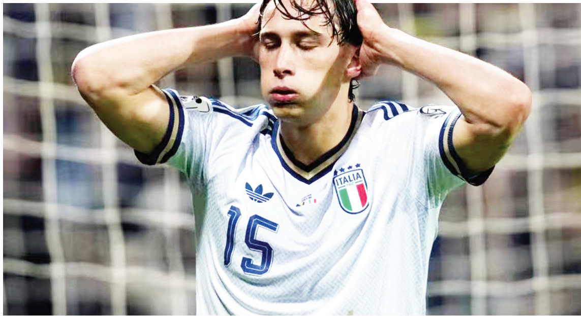
意大利队球员埃斯波西托在比赛中。