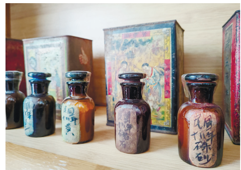
霍庆有收藏的老颜料。