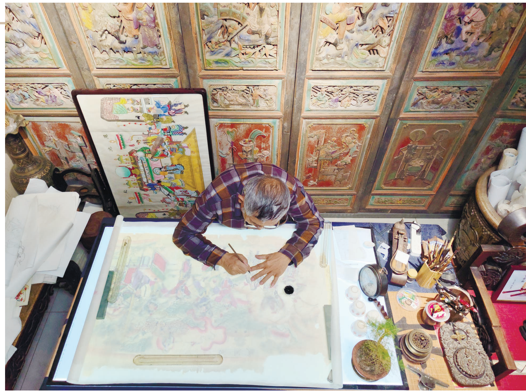
霍庆有抢救的老年画已有200余种样式。