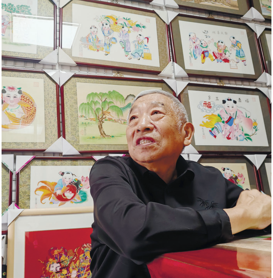
这些年陆续“复生”的《天官赐福》《踏雪寻梅》《马上封侯》等老年画挂满工作室。