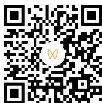
扫描二维码 观看天大海棠季

2026年天津大学海棠季校园开放日如约而至,从活动首日以来,超10万人共赴这场浸润学府气质、彰显科技文化的春日盛会。今年,天津大学特别面向中学生开放入校通道,在校初、高中学生及陪同家长可免费预约入校。昨日,卫津路校区专场活动集中举行,一所大学的开放、创新、雅韵、和美在此交织呈现。