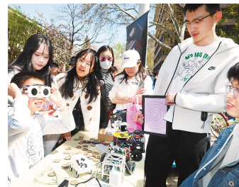
小学生试戴大学生制作的 可调光眼镜