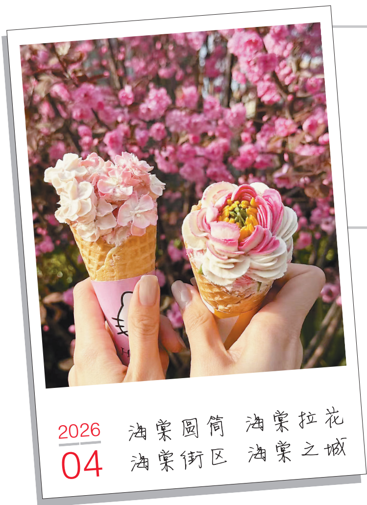
2026 04 海棠圆筒 海棠拉花 海棠街区 海棠之城