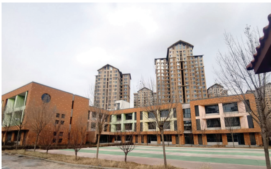
金桥街仁欣幼儿园

东丽湖片区目前有两所学校正加紧建设。其中,耀华中学东丽学校位于丽潭路、湖湘道、丽泽路、金钟河道围合区域,为一所完中校。目前主体已封顶,预计2026年年底建成,计划2027年9月投入使用。