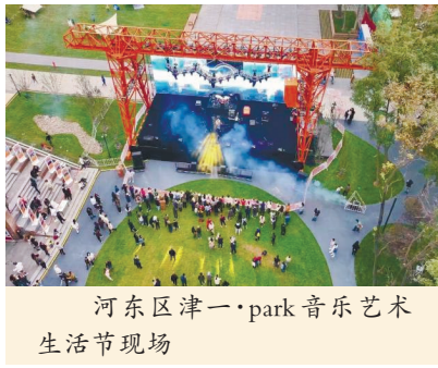
河东区津一·park 音乐艺术生活节现场

为什么能持续释放“新意”?他归结为三个问题的回答:如何留住根脉?总装车间改造成天津机床工业博物馆,“年轻人会感受到什么是‘精益求精’、什么是‘工匠精神’”。如何回应需求?草坪里设置宠物活动区,配套宠物拾便箱、文明养宠提示牌,让文明养宠从“约束”演进为“共鸣”。如何持续赋能?拓展新时代文明实践点,常态化开展宠物生活节、工业记忆市集等活动,“群众愿意来、来了有收获,文明理念就实现了融入融合”。