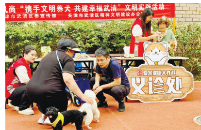
“携手文明养犬 共建幸福武清”文明养犬活动现场,宠物医生正在为宠物犬看诊

“堵”上彰显管理力度。坚持多渠道排查不文明行为,深入开展“脚步丈量文明”行动;坚持多举措强化治理,将人防与技防相结合,劝导与强制相结合,有效遏制不文明行为发生;坚持多部门高效联动,健全“属地主抓、部门协同、上下联动”工作机制。