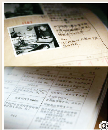
图①“天津”牌手风琴 图②鸚鵡乐器有限公司车间 图③天津市档案馆馆藏“鸚鵡”牌手风琴资料 图④“鸚鵡”牌手风琴获奖证书