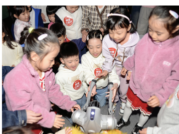
宇树科技 Go2 机器狗与现场观众互动

“什么是病媒生物?”“外来物种有哪些?”“它们会对国家生物安全造成哪些危害?”在活动现场,天津海关关员围绕总体国家安全观的内涵、国门生物安全的基本概念、国门口岸卫生检疫的历史沿革等内容,向参加活动的孩子和群众进行了详细讲解,并结合图文资料,生动介绍了防范外来物种入侵的相关知识,宣传海关在国门生物安全领域筑牢“第一道防线”的重要作用。讲解之余,关员们还通过现场问答、互动体验等方式,引导公众共同构建国门安全认知体系,让