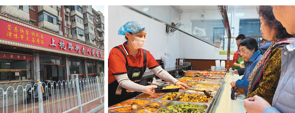
上杭路街老人家食堂

群众最关心的老年助餐服务,是今年民政工作的重中之重。据介绍,本市民政部门统筹推进助餐网点布局、模式创新和品质提升,实现民生保障提质、就业岗位扩容、经济动能释放的多重成效。