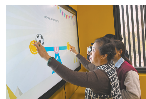
广开街综合养老服务中心