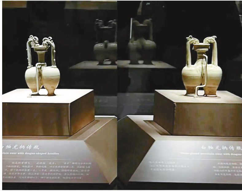
天博(左)与国博两只传瓶“同框”

“感受‘李小孩’的顶奢”“瓷器中的‘白富美’”……日前,“李静训和她的时代”特展在中国国家博物馆开展,迅速成为国内文旅热点。其中,来自天津博物馆的隋白釉双龙柄联腹传瓶以独特的造型和极高的学术价值脱颖而出,不仅在现场受到观众追捧,在小红书等社交平台也引发广泛关注,线上线下反响热烈。