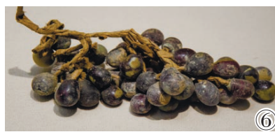
图①北齐白石造像 图②白石圆雕供养菩萨像 图③鎏金铜天王像 图④鎏金铜力士像 图⑤清鎏金点翠累丝龙凤纹银冠 图⑥北宋琉璃葡萄