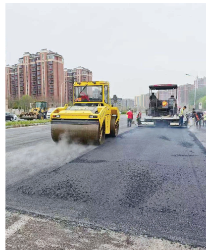
东丽区跃进北路与方山道交口