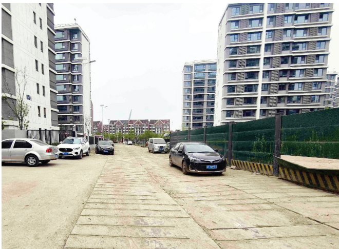
通往小区的多条临时道路仍为土路,下雨天泥泞不堪,刮风天尘土飞扬。