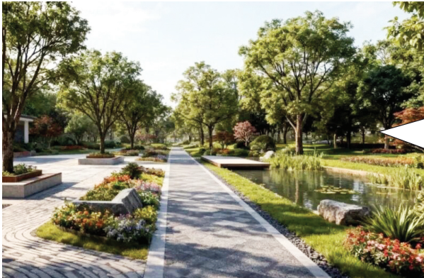
桥北实验小学口袋公园效果图