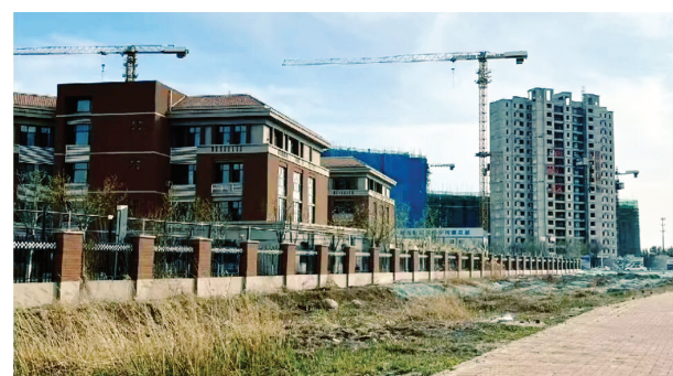
桥北实验小学口袋公园现状