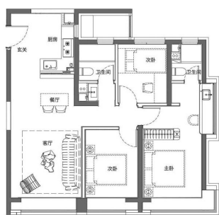
和平区约109平方米三室

本市首个现房销售精致高层作品,极具目前楼市居住产品的多个细节优势,拥有城市中心区的繁华。