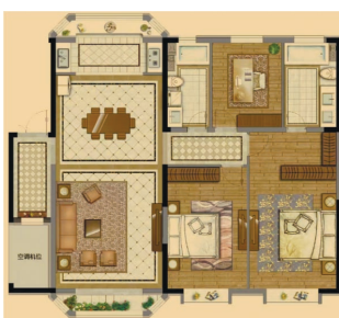
南开区约153平方米洋房

本市首个现房销售精致高层作品,极具目前楼市居住产品的多个细节优势,拥有城市中心区的繁华。