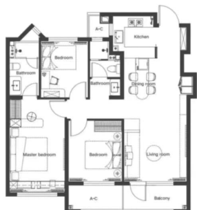
河东区约100平方米三室

该产品闹中取静,既有城市的繁华也有悠闲自得的生活质量,产品包括建筑面积约89—108平方米的26层高层及128—143平方米的17层小高层。