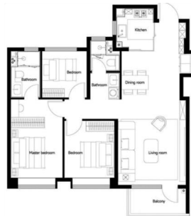
红桥区约111平方米三室

中环线内低密度居住区,私享约22000平方米的江南园林式私家花园,坐拥北运河带状公园与问津园,享有便捷的地铁上盖资源,兼得城市繁华与自然静谧。