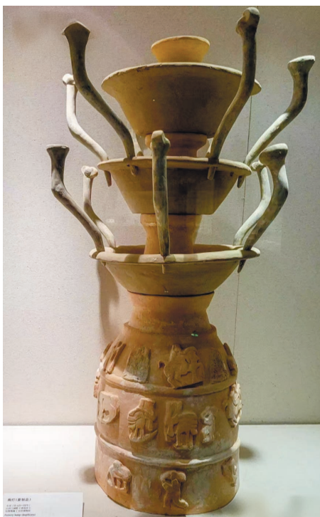
鲜于璜墓出土的陶灯