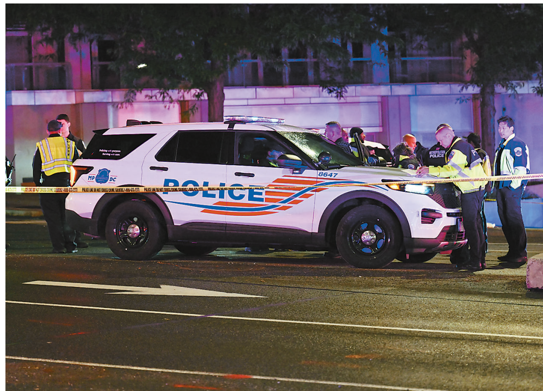
警察在华盛顿希尔顿酒店附近警戒