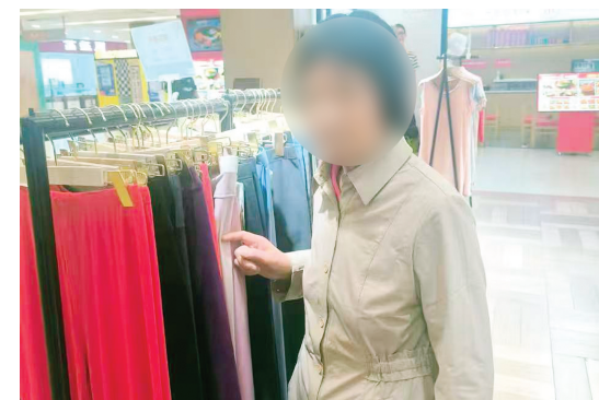
犯罪嫌疑人指认现场

到商场遇到心仪商品本应付款带走，然而，一女子却玩起了“零元购”，警方调取视频监控回溯追踪，最终抓获嫌疑人。