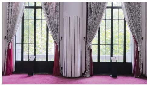
窗外是在津日军代表签署受降协议历史现场