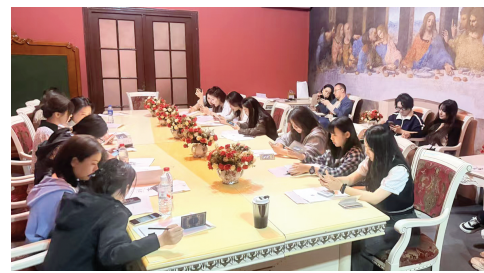
游客解谜现场