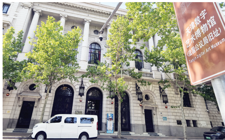
法国公议局大楼旧址外观

如今,它变身为天津数字艺术博物馆。在这里,历史不是冰冷的铅字与墙砖,而是可扫码的数字馆藏,是可触摸的场景再现、是可共情的鲜活体验。