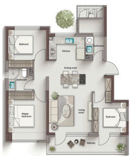
“隐奢”海派洋房 约95平方米三居室