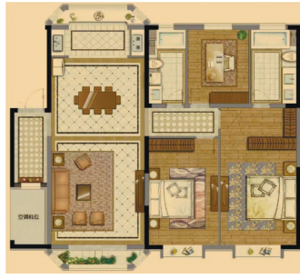
回归城市居住生活 约153平方米洋房

“隐奢”不是一种固定的风格,而是一种体系化的表现。当楼市“隐奢”风逐渐兴起,不仅重塑了高端楼市的产品逻辑与价值标准,也映照出对理想生活状态的持续探寻与定义,它提醒市场关于“家”的梦想,永远有未被满足的深度,等待被理解与实现。