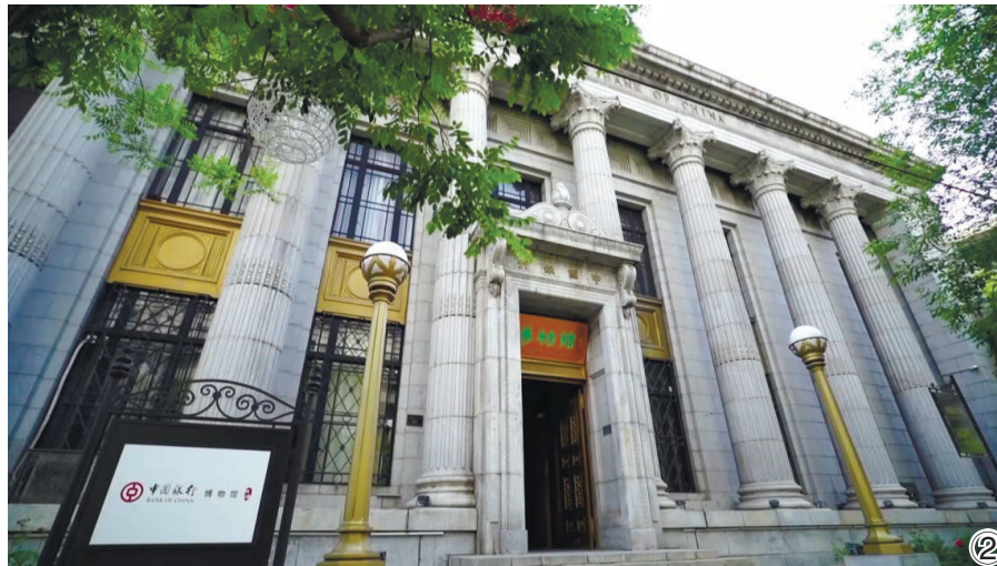
图②中国银行天津分行博物馆