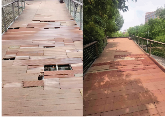
观景栈道修复前后