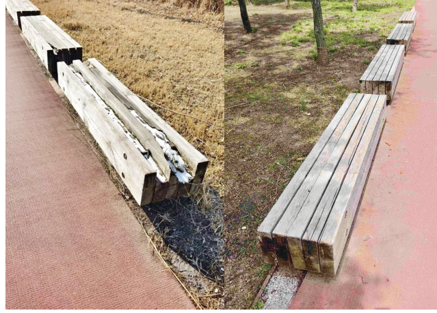
腐烂破损的木质长方形坐凳修复前后