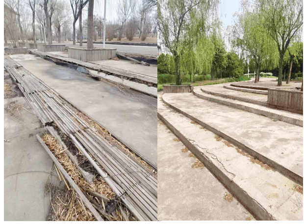
木质阶梯型露天座椅修复前后