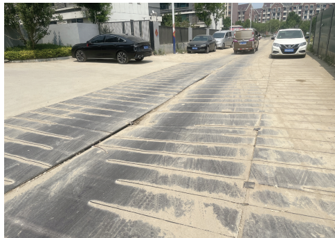
部分钢板边缘翘起、变形开裂。

静海区团泊新城西区万达自在澜湾小区业主反映称,小区一期、二期、三期已入住多年,但小区出入口处无正规道路,居民长期依靠破损钢板临时路通行,出行安全与日常生活受到严重影响。