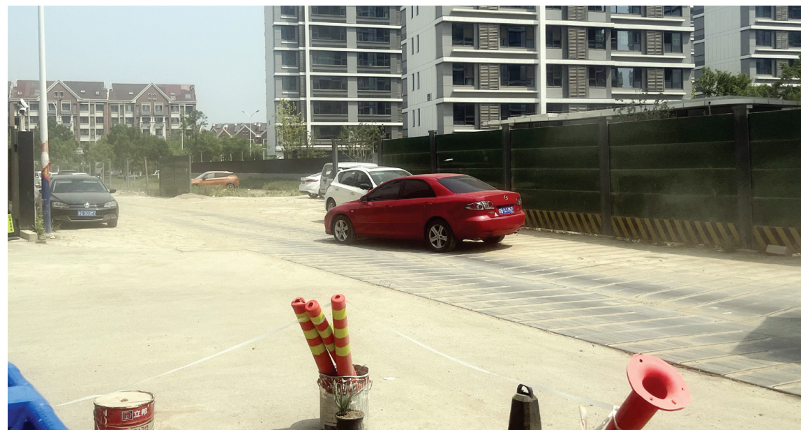
车辆驶过坑洼不平的钢板路,尘土飞扬。