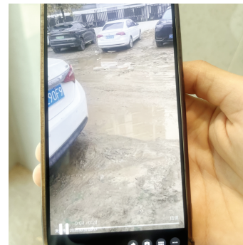
居民反映雨天路面泥泞、爆胎频发。截图自业主微信群