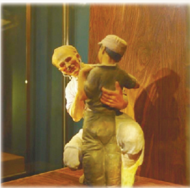
张乃英作品《白求恩》 泥人张世家第五代传人