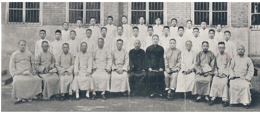
市立第十七小学校高级第二十五届毕业师生合影(摄于1938年7月)