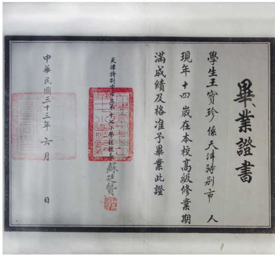
市立第十七小学校(玉皇庙小学校)毕业证书(1944)